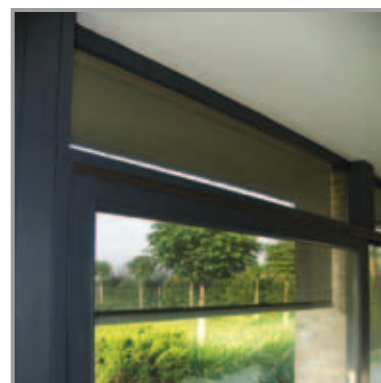
Vista desde el interior

RENSON® se reserva el derecho de realizar modificaciones en los productos discutidos. El folleto más reciente se puede descargar en www.renson.es