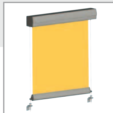
Guiado por cable